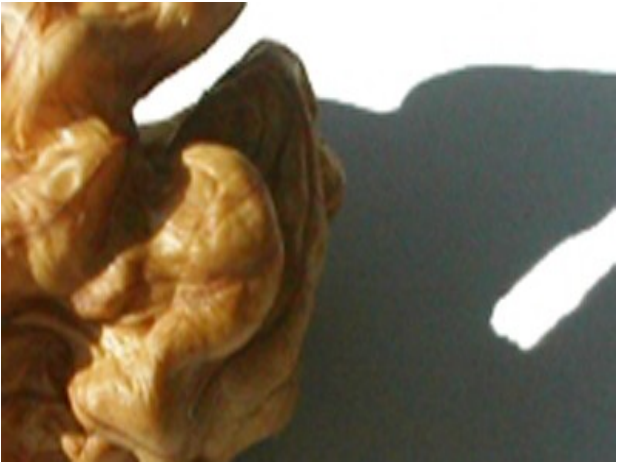
aus psychopädagogischer Sicht

Was soll ich tun? Ich klicke auf ein Bild.