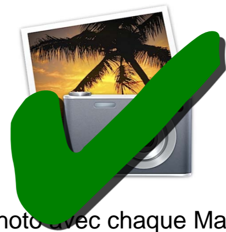
iPhoto avec chaque Mac