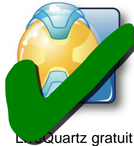
Linux Quartz gratuit