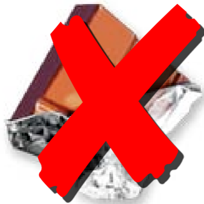
Chocoflop gratuit Beta > $