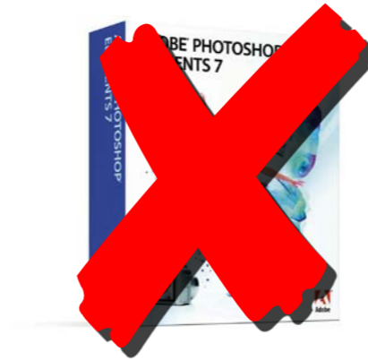
Photoshop Elements $