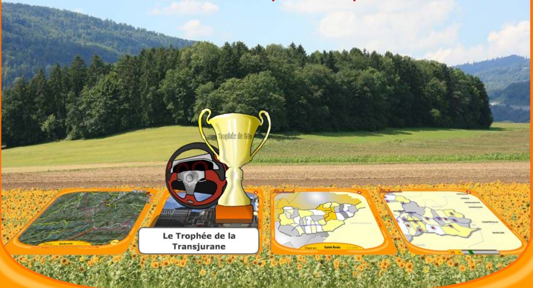
Le Trophée de la Transjurane